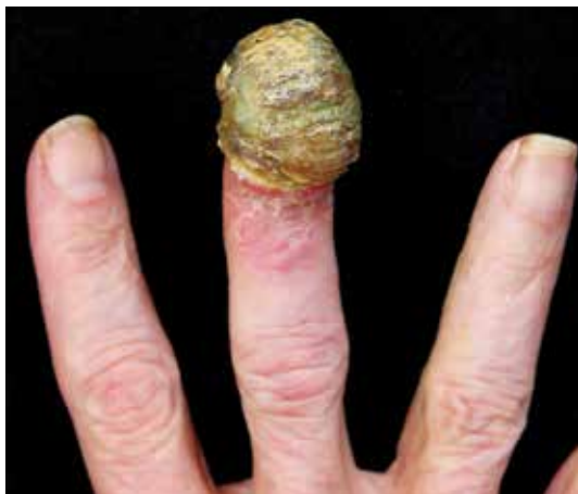
FIGURA 1. Placa tumoral cubierta por costra serosa que compromete el lecho ungular del tercer dedo de la mano derecha.