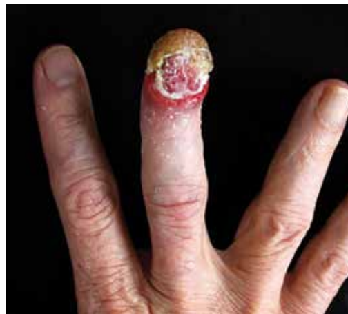
FIGURA 2. Placa tumoral que compromete el lecho ungular, con anoniquia secundaria en el tercer dedo de la mano derecha.