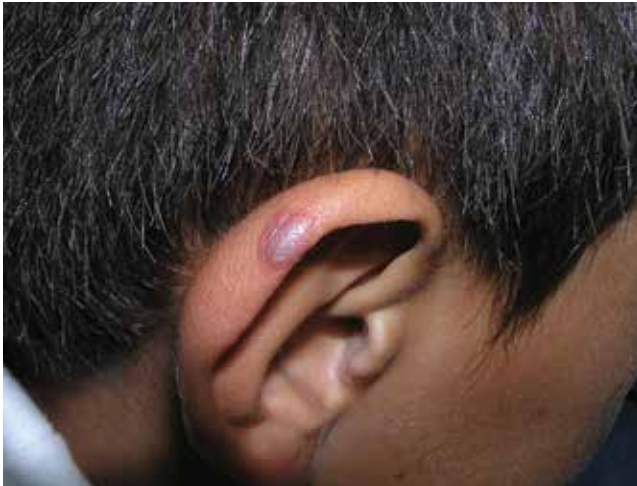
FIGURA 1. Lesión 'névica' en el polo superior de la oreja derecha.