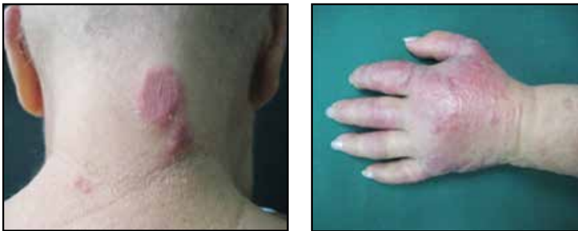
FIGURA 3 Y 4. Placas eritematosas infiltradas con tendencia al ampollamiento.