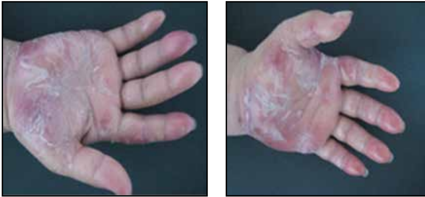
FIGURA 1 Y 2. Acentuado eritema y edema en las palmas.