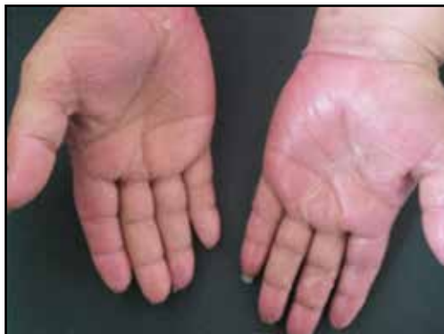
FIGURA 7 Y 8. Resolución casi completa de las lesiones a las 2 semanas de tratamiento.

pollas subepiteliales; presencia de infiltrado inflamatorio perivascular y en el intersticio, numerosos polimorfonucleares neutrófilos con leucocitoclasia, sin vasculitis evidente; también se observaron algunos histiocitos. Esto confirmó el diagnóstico de síndrome de Sweet (FIGURAS 5 Y 6).