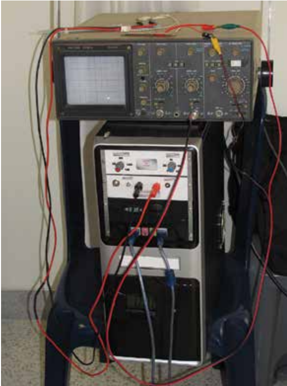
FIGURA 1. 'Electroporador', equipo médico utilizado para generar electro-permeabilización de la membrana celular.

Caldas, en asocio con ingenieros de la Universidad Nacional de Colombia, sede Manizales, mantiene abiertas líneas de investigación con talento humano idóneo. En concordancia con estas líneas investigativas, se propuso el desarrollo tecnológico local y el estudio clínico de la electroquimioterapia en pacientes con cáncer de piel, dado que se carece de experiencia sobre este tema en el ámbito nacional y local, y no se tienen datos en nuestra población de la respuesta a esta nueva alternativa de manejo.