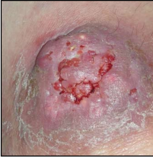
FIGURA 1: Lesión tumoral de aspecto verrucoso, con pseudoquistes en su interior.