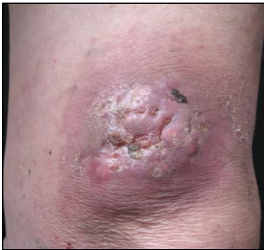
FIGURA 2. Bordes infiltrados y crecimiento rápido. Se aprecia claramente las lesiones quísticas en el interior del tumor.

El pilomatrixoma usualmente se presenta como una lesión solitaria, asintomática, localizada en la cabeza, el cuello y las extremidades superiores. Su tamaño puede variar entre 0.5 cm a 3 cm de diámetro. Cuando la lesión mide más de 5 cm de diámetro se le denomina pilomatrixoma gigante. 2,3 Hasta el momento se han descrito diferentes variantes clínicas, entre ellas las formas ampollosa, perforante, anetodérmica, linfangítica, múltiple y familiar. 4 En las formas familiar y múltiple se ha encontrado asociación con distrofia miotónica, síndrome de Turner, síndrome de Gardner, xeroderma pigmentoso y síndrome del carcinoma basocelular nevoide. 2-4