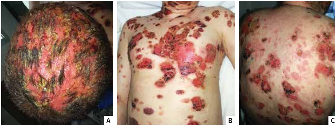
FIGURA 2. Paciente posterior a la terapia con esteroides e inmunosupresores. A. Cuero cabelludo. B. Tórax anterior. C. Tórax posterior.

inducido por fármacos. En este grupo, el más común es el pénfigo vulgar 1,2 .