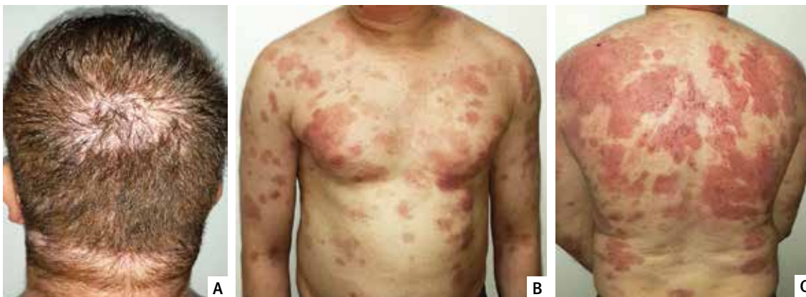
FIGURA 3. Paciente 30 días después de la segunda aplicación de Rituximab. A. Cuero cabelludo. B. Tórax anterior. C. Tórax posterior.

El 70 a 90 % de los casos se inician con compromiso mucoso, principalmente en la cavidad oral, donde son poco evidentes las ampollas, y predominan las erosiones dolorosas y persistentes; también, se pueden afectar la mucosa conjuntival, la esofágica y la genital. En pocos meses aparecen las lesiones cutáneas, las cuales se caracterizan por ampollas flácidas y generalizadas que, por