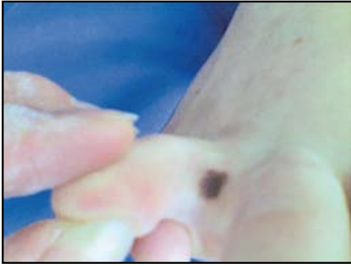
FIGURA 1: mácula hiperpigmentada con bordes irregulares en el espacio interdigital.

La evolución del melanoma acral está descrita como una mácula oscura, plana, que tiene un crecimiento lento y continuo durante muchos años, con una periferia definida pero irregular. Por esto muchas lesiones llaman la atención o son reconocidas como melanoma in situ cuando ya pasan de un centímetro. El examen de dermatoscopia puede ayudar debido a que la pigmentación en el nevus acral sigue los surcos entre los dermatoglifos mientras que en los melanomas a menudo se pierde. Se han reportado casos de melanoma acral formados sobre nevus preexistente y al parecer representan un 10% del total; sin embargo, la incidencia real de esta evolución no está claramente definida. La fase temprana del patrón lentiginoso de melanoma in situ de piel acral puede ser difícil de distinguir de una mácula melanótica o comúnmente de un nevus, debido a que pueden compartir algunos hallazgos histológicos. Sin embargo, existen aspectos histopatológicos a tener en consideración 2 como los vistos en nuestra paciente, que son algunos de los más remarcados en la literatura, 3 entre ellos la presencia de melanocitos con núcleos más grandes, angulados, hiper-cromáticos y oscuros, las dendritas más gruesas y la proliferación continua de melanocitos en la capa basal. En el patrón lentiginoso del melanoma acral no es usual que se formen nidos y puede haber un escaso infiltrado inflamatorio acompañante sin fibrosis.