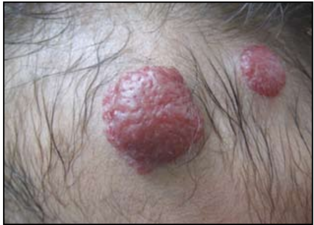
FIGURA 3: Acercamiento de las lesiones del cuero cabelludo.

La hemangiomatosis neonatal benigna es un desorden