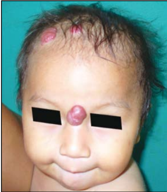
FIGURA 1: Hemangiomas en región glabellar, línea media frontal y parietal. Sin ulceración.