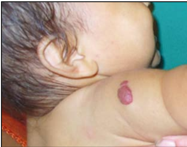
FIGURA 2: Hemangioma rojo brillante con forma de domo en el hombro derecho.

inicial de rápido crecimiento seguida de una fase de lenta involución en los primeros años de vida. 1