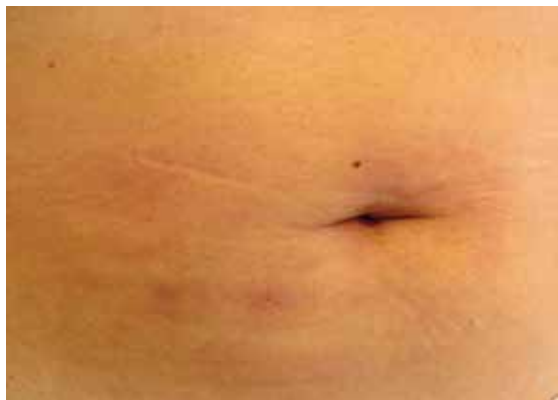
FIGURA 1. Nódulos y placas eritematosas que confluyen en la región periumbilical.