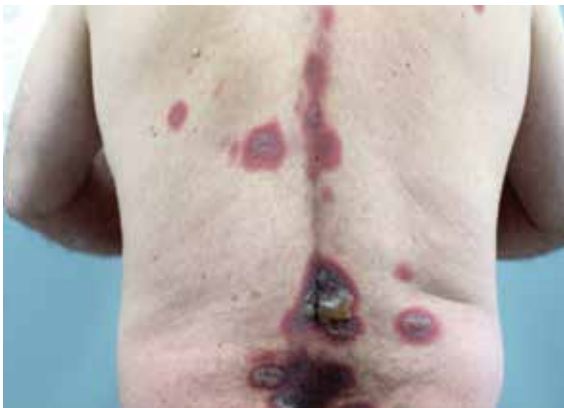
FIGURA 3. Máculas eritemato-violáceas y ampollas flácidas.

Las erupciones fijas medicamentosas se manifiestan como máculas oscuras circunscritas que se resuelven dejando hiperpigmentación residual 1 . El sello distintivo es la memoria geográfica, es decir, recurrencia de la lesión en el lugar previo de aparición 3 ; esto podría explicarse por la presencia de linfocitos T de memoria residentes en los tejidos que permanecen en la piel por largo tiempo tras la exposición, en este caso, a medicamentos 4 . Las lesiones suelen localizarse en el área genital, la mucosa oral, las palmas, las plantas o en cualquier otro sitio anatómico 1 .