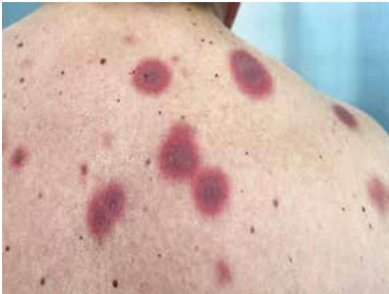
FIGURA 1. Máculas eritemato-violáceas en la espalda.