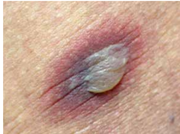
FIGURA 2. Ampollas flácidas.