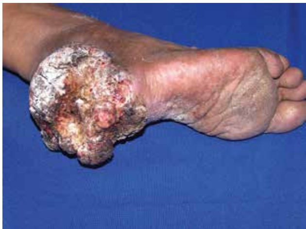
FIGURA 1. Tumor verrugoso del talón derecho.