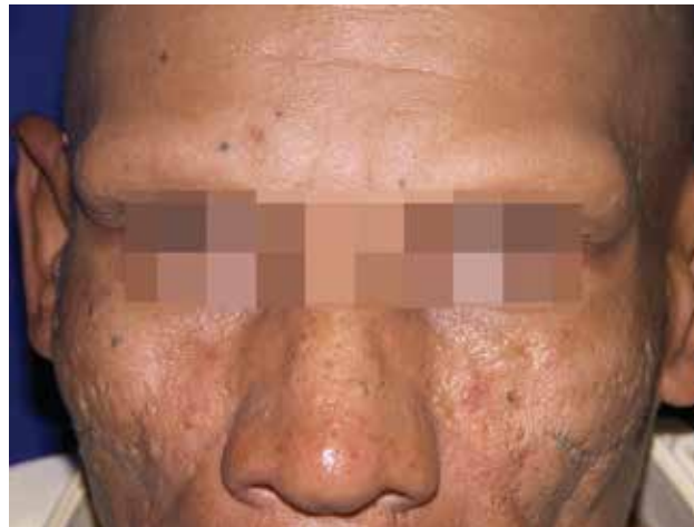
FIGURA 2. Alopecia total.