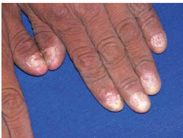
FIGURA 3. Distrofia ungular.